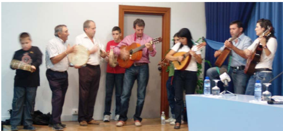
Cuadrilla de ánimas de Aguderas